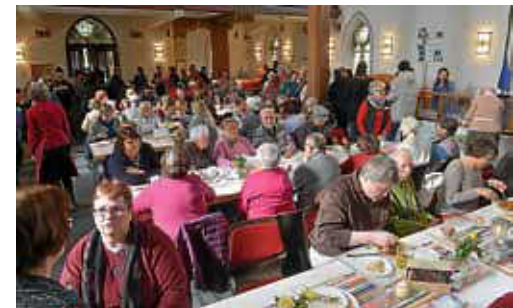
Bis zu 70 Ehrenamtliche tragen täglich zum Gelingen der Vesperkirche bei.

Text: Vanessa Lang