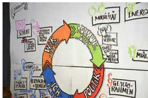
Das „Big Picture“ veranschaulicht die Ergebnisse des Jugendgipfels.

Text: Christian Netti