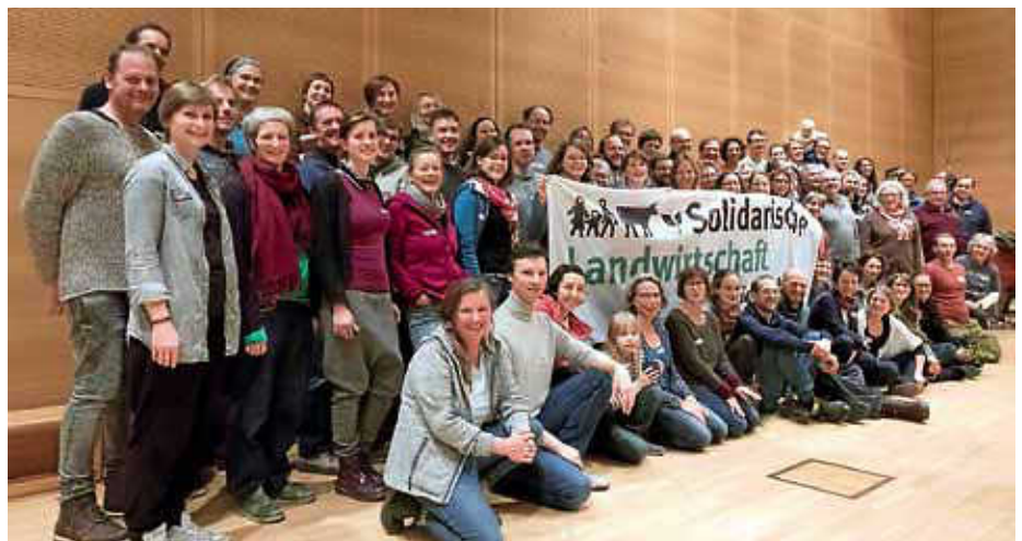
Die Mitglieder der SoLawi freuen sich über neue Teilnehmer

Seit fünf Jahren bauen die Gärtner und Gärtnerinnen der „Solidarischen Landwirtschaft Ravensburg e.V.“ in Hübscher Gemüse an. Über 240 Mitglieder haben bei der „SoLawi“ 130 Gemüse-Anteile gezeichnet. Sie finanzieren damit über einen Monatsbeitrag den Gemüseanbau und erhalten im Gegenzug einen Anteil an der gesamten Ernte. Angebaut wird Gemüse von Aubergine bis Zwiebel und „Gemüse mit Charakter“ wird ebenfalls geliefert. Die inzwischen fünf Gemüse-Verteilstellen in Ravensburg-Süd, Ravensburg-Nord, Weingarten, Baienfurt und am Hof sind rund-um-die-Uhr zugänglich. Wer Lust auf Gemüse in der Saison 2020 verspürt, melde sich unter: ichwillgemuese[at]solawi-ravensburg.de .