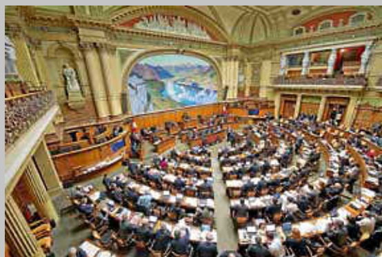
Eine Parlamentssitzung im Nationalrat ist ein Höhepunkt der Fahrt nach Bern