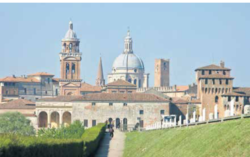
Die einzigartige Stadtansicht von Weingartens Partnerstadt Mantua zieht Menschen aus aller Welt in ihren Bann