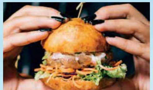
Streetfood-Market + Grillpark