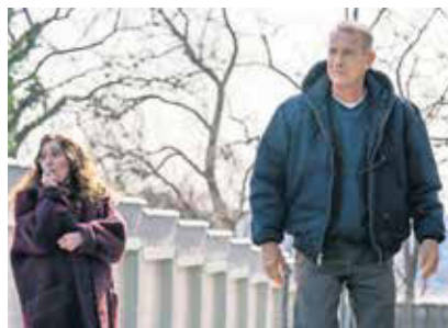
Ein Mann namens Otto - Sony Pictures