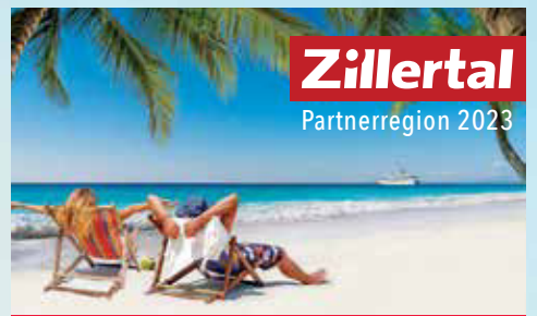
Zillertal Partnerregion 2023