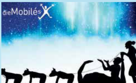
„Moving Shadows“- mehrmals täglich