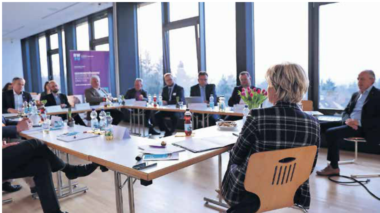
Wirtschaftsministerin Dr. Nicole Hoffmeister-Kraut im Austausch über die Gesundheitswirtschaft in der Region und in der Zukunft.